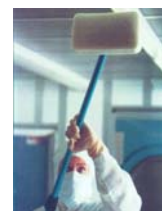
... und Wand