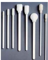
Tupfer, verschiedene Typen