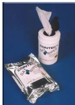
SAT Wipe Feucht - Reinigungstücher