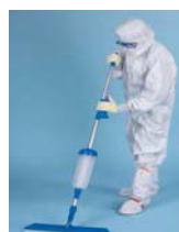
Reinigungssysteme für Boden